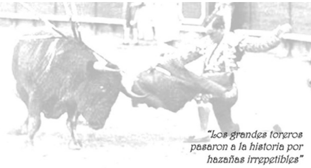
"Los grandes toreros pasaron a la historia por hazañas irrepetibles"

Inicio Opinión La temporada Cartel de ferias Entrevistas y reportajes Anales del Toreo Artes y Letras