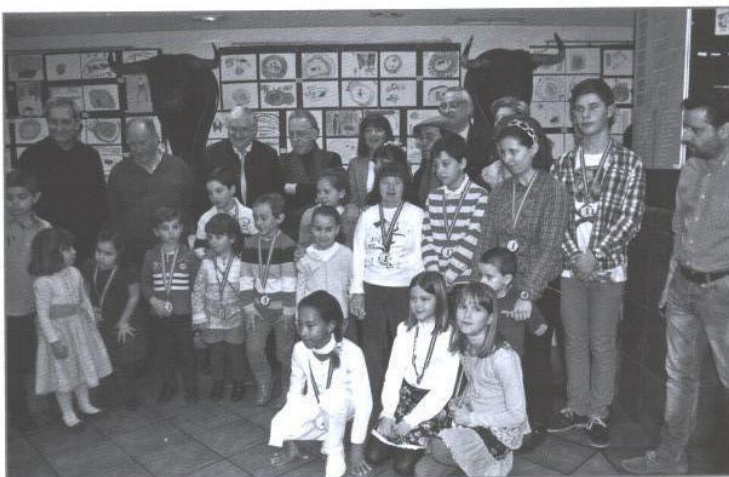
El Jurado con los premiados.